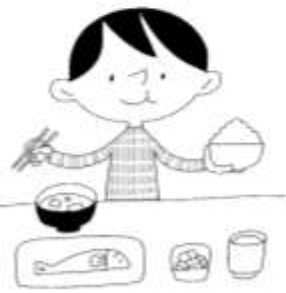
栄養バランスのよい食事