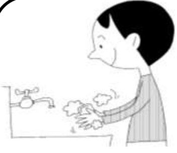
こまめに手を洗う