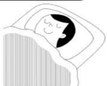
しっかりすいみんをとる