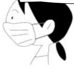
マスクを着用する