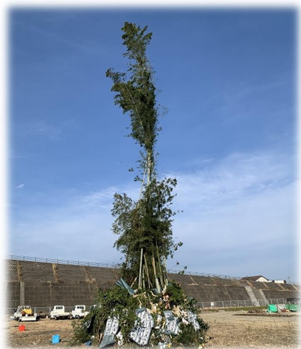
【ギネス記録にも及ぶ高さ21m】